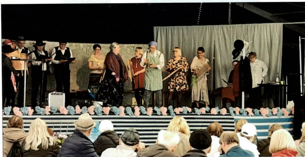
Kuva 1. KevätKimara-tapahtuma torilla toukokuussa 2022.

Toukokuussa pystyttiin koronan hellittäessä otettaan järjestämään torilla Kulttuuriväärtiesiintyjien toimesta ns. KevätKimara-tapahtuma, jossa oli elävää musiikkia ja näytelmä. Osallistujia tähän tapahtumaan oli 180 henkilöä.